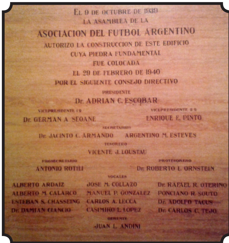
Placa recordatoria de la colocación de la piedra fundamental del edificio de la A.F.A. Placa recordatoria inauguración del edificio de la A.F.A.