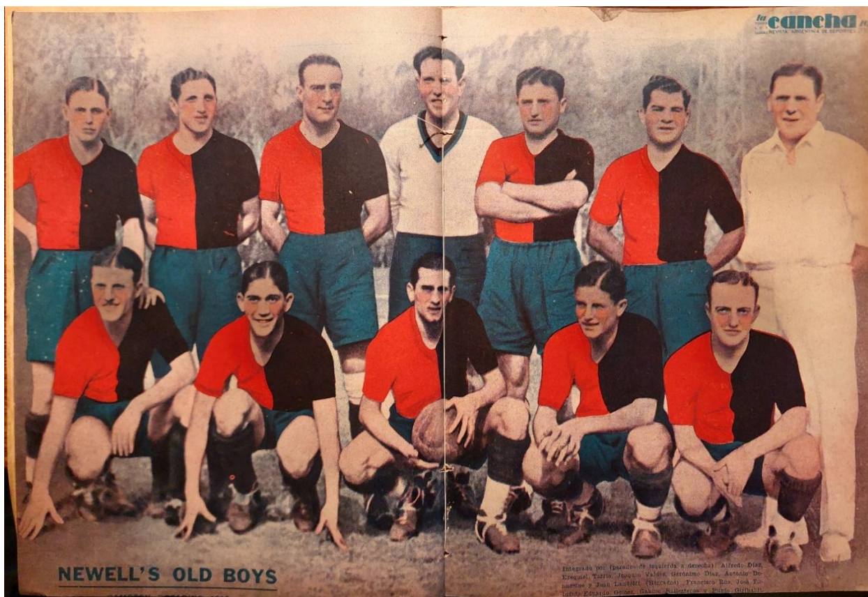
Lámina de Newell's Campeón 1934 revista La Cancha .