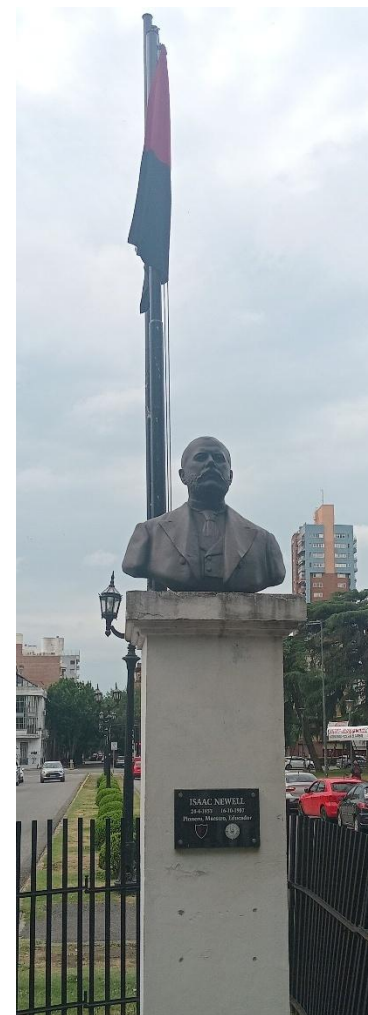
14 diciembre 2025.