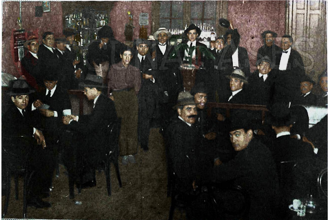
Aspecto del Bar de los Celli. Foto revista El Gráfico , febrero 1924.

Fotos: Zanabria celebrando su gol del empate 2a2, revista El Gráfico . La Población Leprosa convirtiendo en vueltdromo el reducto militar. Juan Carlos Montes y Zanabria dando la vuelta 2 junio 1974, diario Cronica .