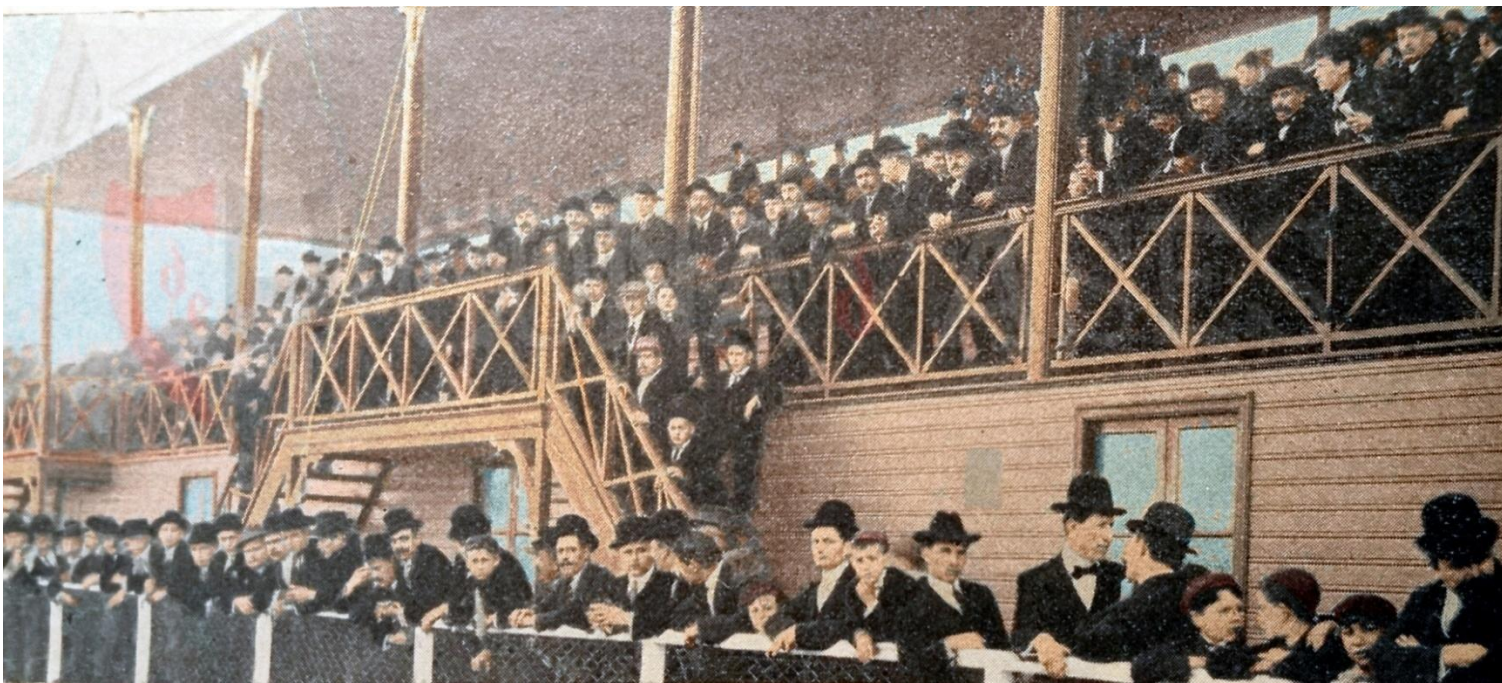
Aspecto de la flamante Tribuna oficial de madera en el novedoso Estadio del Parque. Foto revista MONOS Y MONADAS , 1911.