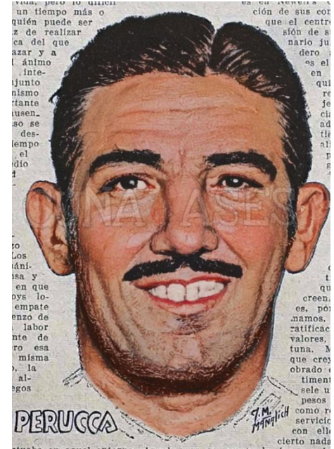
Ángel Perucca, ídolo indiscutido de la afición Rojinegra. Estandarte de los años 1940.

¡Viva NEWELL'S! Fue el grito que pegó Perucca cuando se enteró que las gestiones de los cuadros mediáticos habían fracasado para llevarlo a jugar a la capital. En el verano de 1945, en pleno Sudamericano, Ángel Perucca brillaba en los campos chilenos, y atraía la atención de todos. Su claridad en el juego, su marca aguerrida, y su fuerza para iniciar los ataques, se volvió un clásico en el Parque, y en la Selección. Los porteños sufrían cuando enfrentaban a Perucca dirigiendo la línea media de Newell's (25 goles en 284 partidos). En 1945 Ángel Perucca dejó grabado a fuego el sentimiento Leproso que marca la diferencia entre ser una Gloria Deportiva Rojinegra o ser un mercader olvidado por un puñado de monedas. Tanto impactó la decisión y justificación de El Portón de América , que la revista El Gráfico tuvo que explicarle a la afición porteña por qué Perucca se quedaba en Newell's Old Boys .