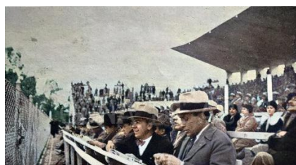
Aspectos de 1930 en el Parque