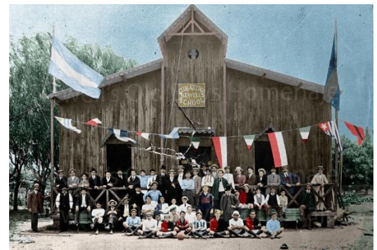
Texto publicado en la prensa rosarina, 2 marzo 1943