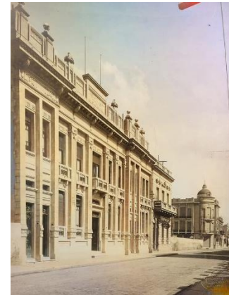
Fachada del Colegio Newell, y casilla Club Colegio Newell