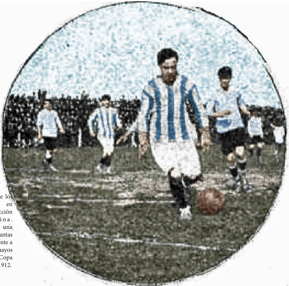
Crack de los ataques en la Selección Argentina. Aquí en una de las tantas bregas frente a los uruguayos por la Copa Newton 1912.

(5) Cita extraída de Edgardo Marín, no precisa la autoría.